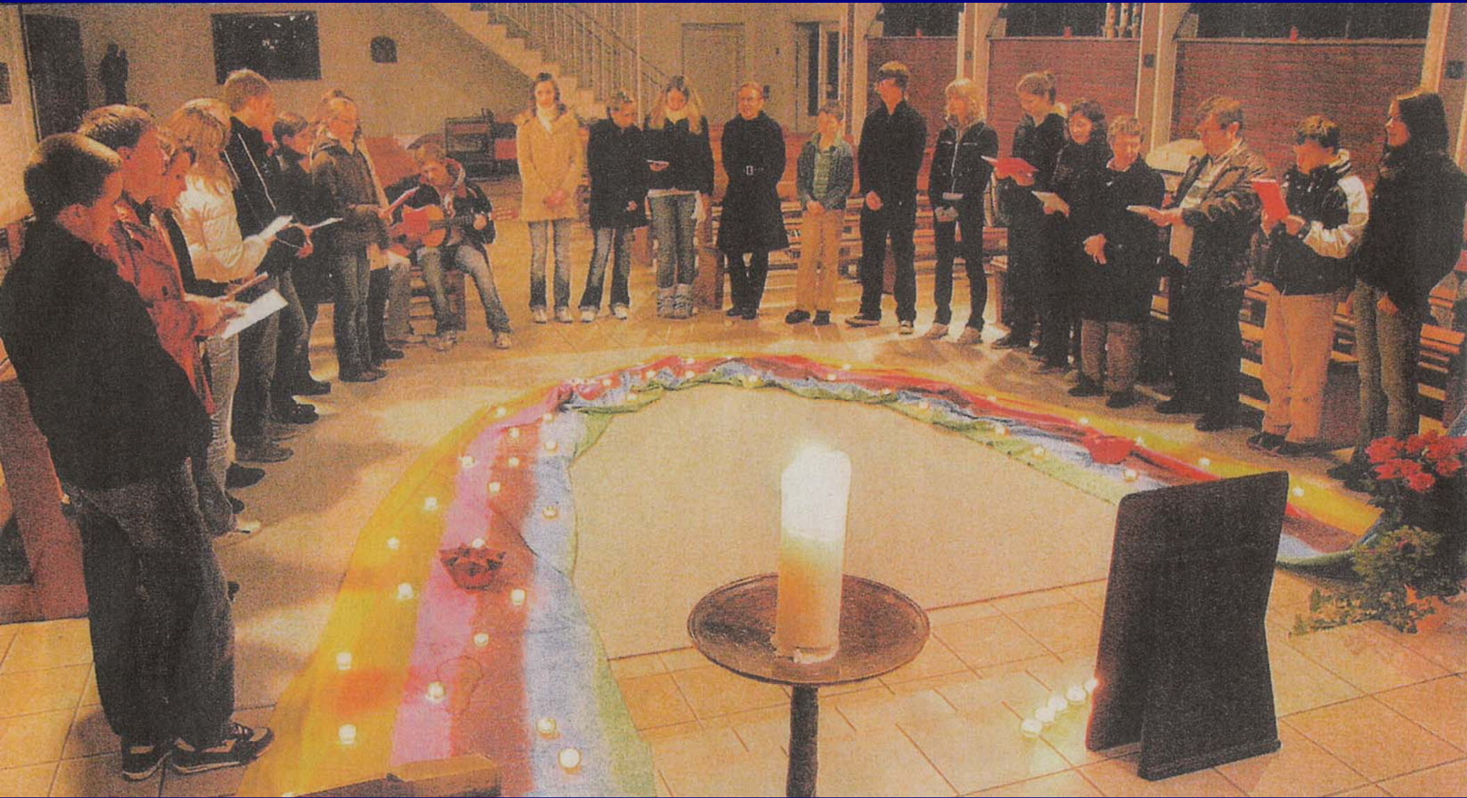
Abendgebet in Lilienthal seit 5 Jahren alle 2 Wochen sonntags um 19 Uhr